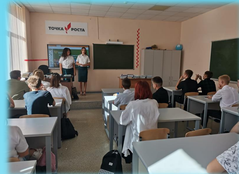
Встречи с выпускниками школы – студентами ВУЗов и ССУЗов