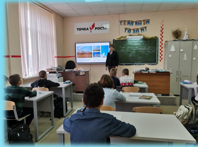
Областной Урок занятости