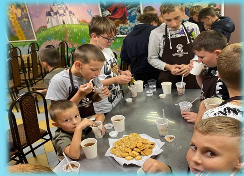
Посещение учащимися предприятий Ростовской области