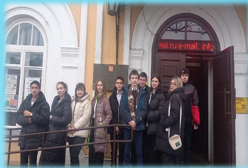
Знакомство выпускников школы с ОО среднего и высшего образования г. Таганрога.