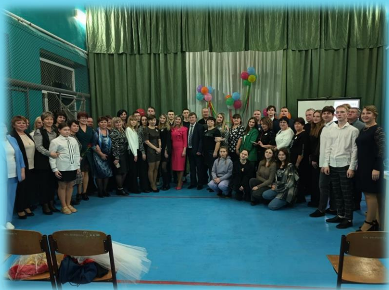
Вечер встречи выпускников школы