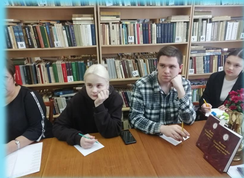
Ежегодная Профдекада, включающая ряд мероприятий, охватывающих учащихся 1-11 классов